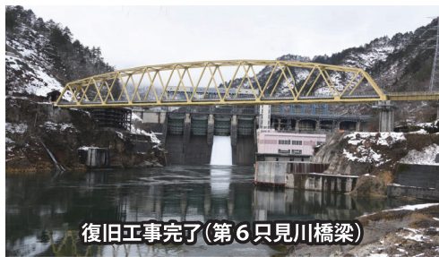
復旧工事完了(第6只見川橋梁)