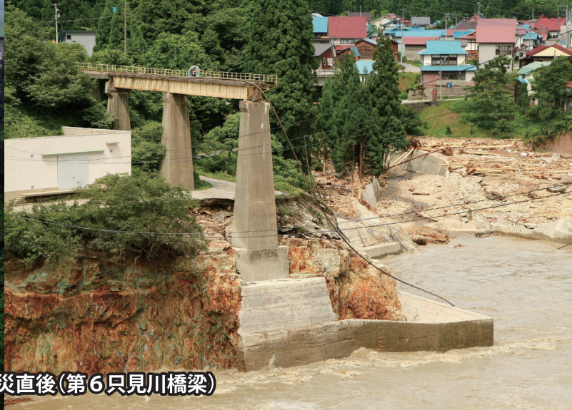
2011年7月 豪雨災害被災直後(第6只見川橋梁)