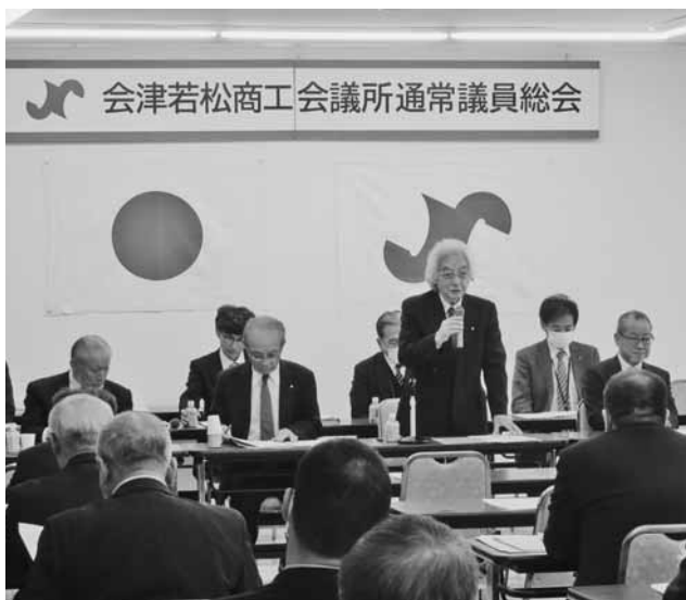
地域経済の回復に向けた諸事業を決めた総会

まる中、具現化のために魅力的なまちづくりを推進します。行政と連携して都市機能の向上を図るとともに、インバウンド再開を契機に観光コンテンツの造成に努めます。 IV・市街地活性化推進 4年度に実施した市民アンケートや有識者会議でまとめた市街地再開発構想の実現に向け、行政と役割を分担しながら進めて参ります。シネマコンプレックスの誘致、大規模空地等の個別課題にも積極的に取り組みを継続します。