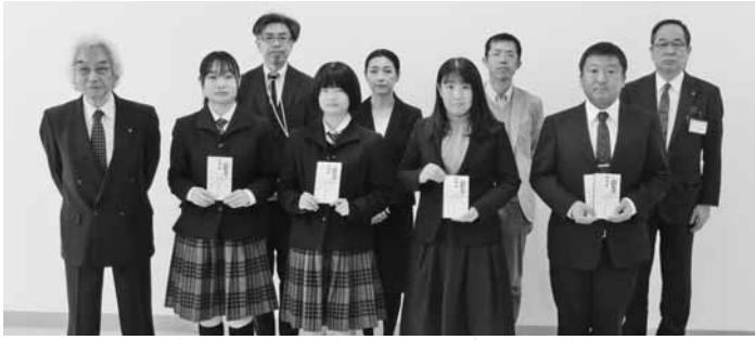
優秀な芸術文化活動に助成金を交付