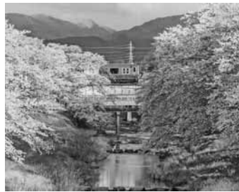
平塚 雄蔵「藤田川の桜」