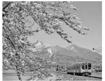
大島 市郎「春の絶景」