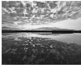
杉原 満「うろこ雲と早苗」