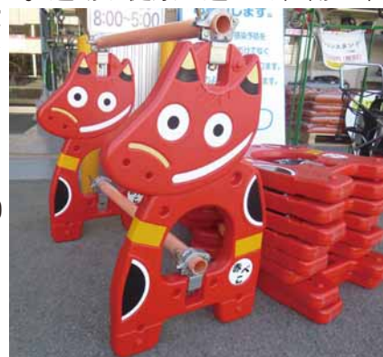
「赤べこ」のご当地バリケード

職員コラム 今年もまた桜の季節がやってきました。市内には、石部桜や鶴ヶ城など有名な桜の名所のほか、多くのお花見スポットがあります。桜といえば、河川沿いに桜並木をよく見かけますが、これはインフラ整備が整っていないなかった時代に「桜の木を植えれば人が集まり自然と地盤が固まる」という先人の知恵だったようです。毎年、千本を超える桜で私たちを魅了する鶴ヶ城のお濠の周りにも立派な桜が並び、一部残る外濠の石垣に