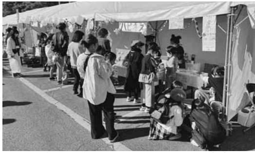
積極的に声掛けし、商品をPRした販売実践

販売実践は、これまでのセミナーや合宿で学んだ商売の知識を最大限に発揮し、各チームで作成した事業計画を基に出店。会津木綿のコースターや、農家から直