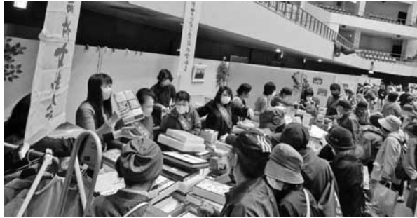
来場者でにぎわう女性会ブース