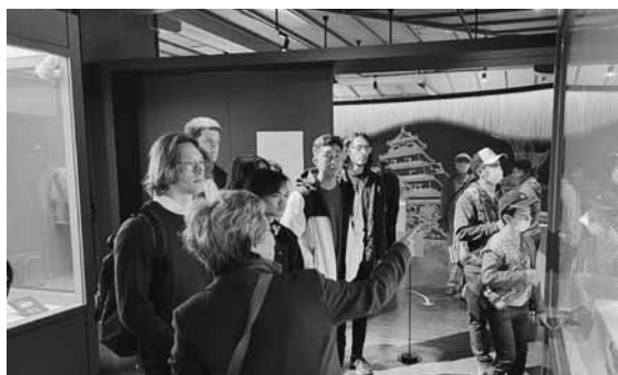
学生から多くの質問が出た鶴ヶ城見学

参加者は会津大学に在籍する外国人留学生7名で、中には10月からの新入生もおり、市内観光は初めてのメンバーだった。当日は鶴ヶ城や酒蔵見学、日新館などを観光し、抹茶体験や芸妓体験、弓道体験などを行った。各所で学生から数多くの質問があり、有意義なツアーとなった。アンケートで特に評価が高かったのは日新館（会津藩の教育・日本の武家文化・日本建築）、体験（抹茶・日本酒・芸妓・弓道）で、ほとんどの学生が日本文化や会津の歴史を知ることに関心と興味を示した。個人的にまた来たいと思うかという設問には、すべての観光地で80%以上が「はい」の回答となった。