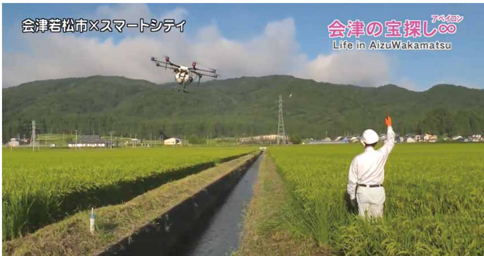
市テレビ広報番組がYouTubeで公開されています。ぜひご覧ください。