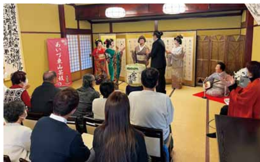
おおいに盛り上がったお座敷遊び体験（22日・渋川問屋）

勤労感謝の日は、「勤労をたつとび、生産を祝い、国民たがいに感謝しあう」日として昭和23年に制定され、五穀豊穡を祝う日本古来の伝統行事・新嘗祭（いなめさい）が由来とされています。「新」は新穀（初穂）を、「嘗」は奉るこ