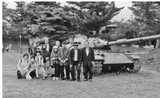
福島駐屯地内展示車両の前にて

楽隊による演奏等が行われ70周年ならではの行事が行われた。参加者は、日々の訓練により技術や心身を磨き、国民の安全・安心を守る自衛隊業務への理解を再認識し、充実した時間を過ごした。