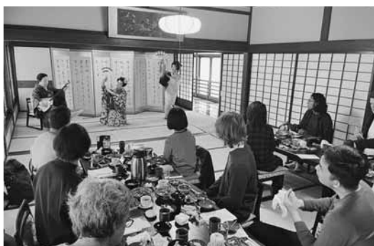
芸妓文化を体験する留学生たち

この事業は、今後のインバウンド観光人口・消費拡大に向けた会津若松市のPR手法や受入態勢の見直しのため、外国人の視点での各観光地の魅力度、看板表示や展示方法について意見聴取・集約し、市内観光関係機関と共有して誘致力・おもてなし力の向上を図る目的で、初めて実施したものの。