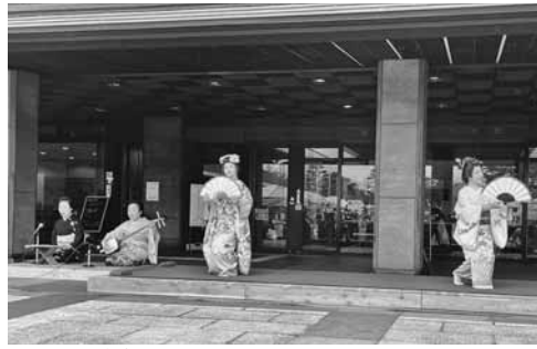
昨年のふれあいDayのひとつコマ

■お問合せ 業務推進課 TEL 27-1212 昨年、続いての開催で、多くの市民や観光客に当市の伝統芸能であり、おもてなしの担い手である東山芸妓をさらに知ってもらい、利用促進を図るのが目的。県立博物館が主催するイベント「雪国ものづくりマルシェ」内にて実施します。日程および内容は次のとおり。 ◇13時～東山芸妓の鶴ヶ城散策・鑑賞会 ◇13時45分～県立博物館前庭特設ステージ・東山芸妓衆の紹介・鑑賞会・お座敷遊び紹介、体験・記念撮影