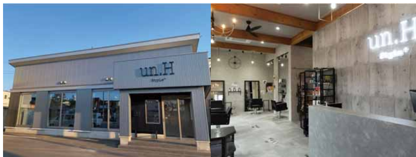
スタイリッシュなお店の外観(左)と落ち着いた内装(右)

暑い時期ももうすぐ終わりですね。この秋は、un.H style+さんでお気に入りのヘアスタイルを見つけてみてはいかがでしょうか。