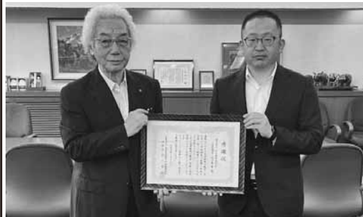
(株)北斗測量設計社様へ感謝状を贈呈