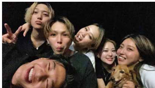
明るいスタッフがお出迎え

Address 会津若松市滝沢町6-20 Number 0242-93-5115 Opening hours 平日10:00~19:00 土日祝9:00~19:00