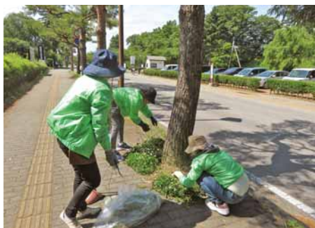
清掃活動に汗を流す会員