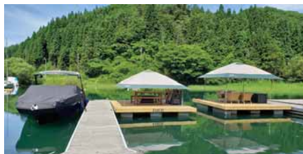
<陸に上がらずくつろげる環境>

ジェットスキーのようなマリンスポーツはいつかは体験してみたいという憧れがありますよね。四季がはっきりしていて、自然環境が豊かなこの会津だからこそ楽しめるスポーツでもあります。こんなことを感じたら、中田浜マリーナさんに足を運んでみてはいかがでしょうか。