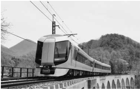
夏休みは特急で浅草に行こう！

東京スカイツリーや浅草寺など、東京屈指の観光名所への旅行に会津・野岩鉄道をぜひご利用ください。 ◆期間 7月21日～8月24日