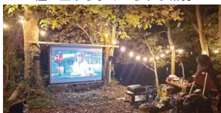
<キャンプ場も併設>