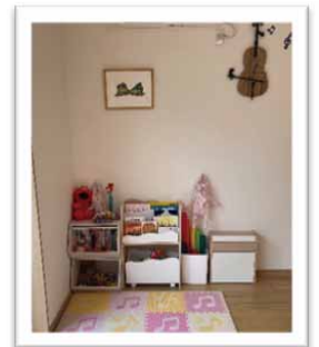
小さいお子様のためのスペース▲