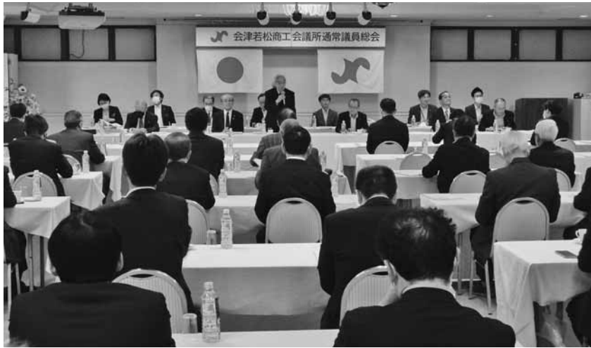
経済回復へ向けた協力を求める渋川会頭