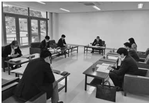
事業計画等を決めた委員会の様子