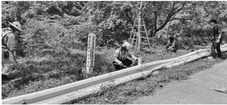
桜周辺の清掃に汗を流す