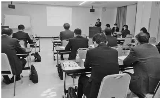
地域通貨について理解を深めた説明会