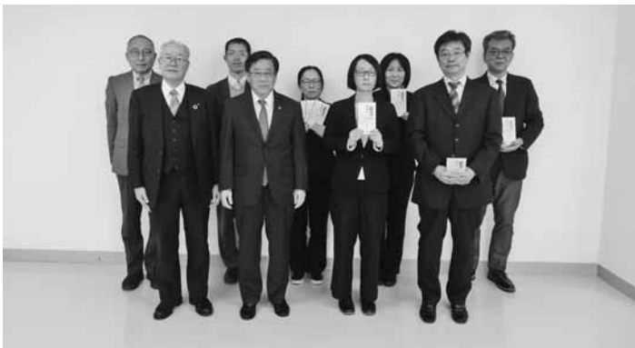
5校の教諭へ助成金を交付

3月17日、20日の会津大学及び短期大学部学位記授与式において会津地域の教育・学術等の振興に寄与した成績優秀な学生に「財団賞」を授与。