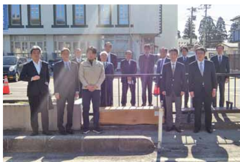
完成したベンチを囲んでの記念撮影

※「液体ガラス含浸処理」 ベンチは会議所前バス停のほか鶴ヶ城、御葉園、市役所新庁舎へ寄贈する予定。