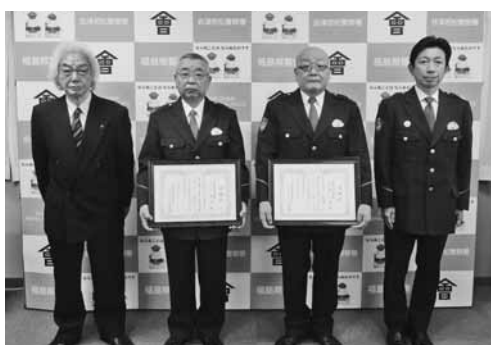
感謝状を受け取った会津若松警察署員