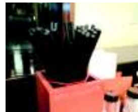
まるまつ会津若松店

ジョナサン→割箸を廃止 デニーズ→ 建築端材を使った割箸 ワタミグループ→全店で割箸を廃止 マルシェグループ→(居酒屋「八剣伝」「居心伝」など)