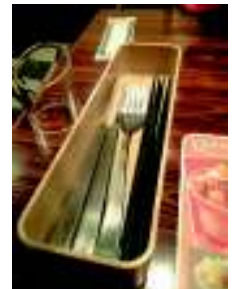
ガスト会津若松店