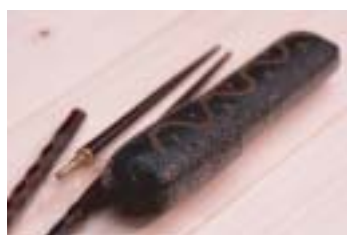
軽くて衛生的な漆塗の箸ケース （鈴勘漆器）