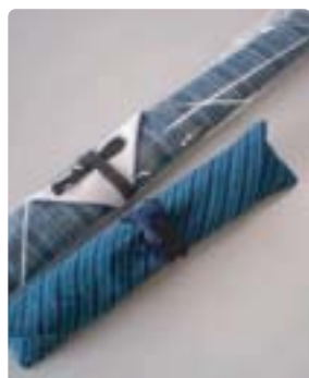
竹箸に会津木綿：写真上（竹藤製）