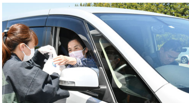
車内で弁当を受け取る来場者