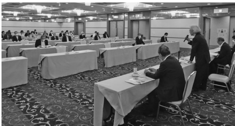
今後の経済回復に向け協力を求めた渋川会頭