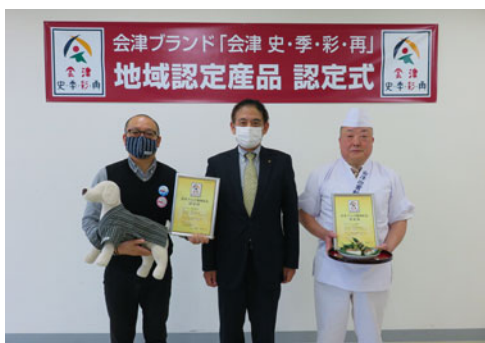
新たに会津ブランドに認定された2事業所