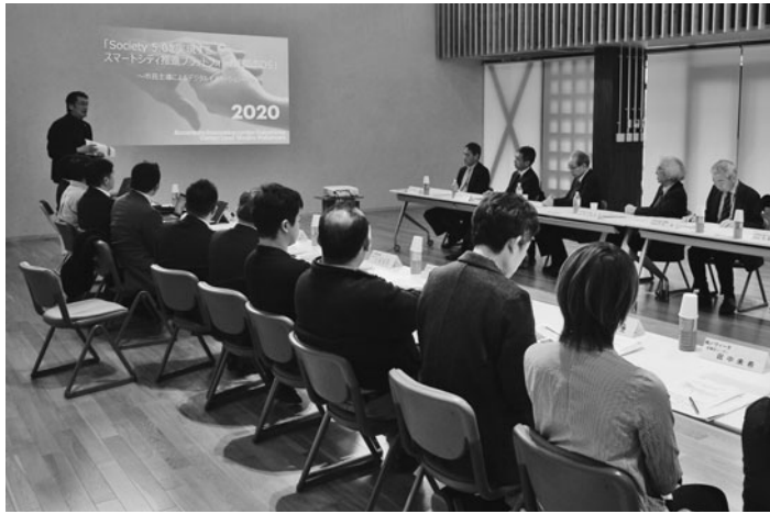
地域経済の振興に向けて連携を確認した懇談会

入居企業の取組も発表され、TIS(株)より当市で展開しているオリジナルアプリを活用した決済事業の実証実験概要が説明された。また會津アクティベートアソシエーション(株)より会津地域の十七の蔵元