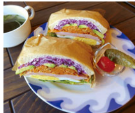
看板メニュー 「ブッシングサンド」800円