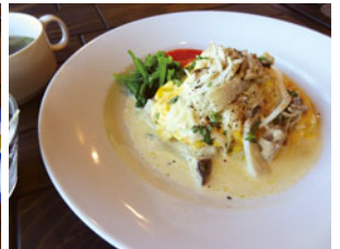
定番メニューの仲間入り 「クリームオムライス」780円

住所：〒965-0807 会津若松市城東町4-15 TEL：0242-93-8181 営業時間：11：00～15：00 定休日：日曜日、木曜日 席：10席（テーブル5） 駐車場：4台