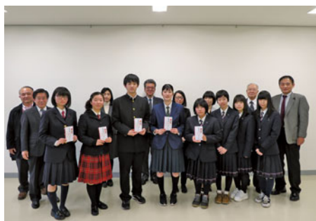
今回助成金を交付した学生

部）／若松商業高校（簿記研究部）／耶麻農業高校（家庭クラブ）／会津学鳳高校（書道部）