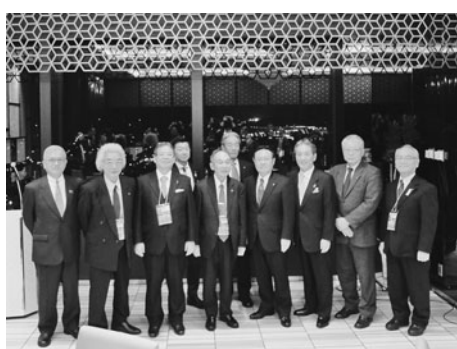
歴史的な縁を確認した交流会

ネットワーク参加商工会議所 函館、余市、むつ、米沢、日光、横須賀、静岡、浜松、岡崎、桑名、京都（支援参加）