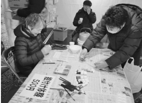
絵ろうそくの絵付け体験を楽しむ来場者

そくの絵付け体験を始め、会津産の味噌田楽やはちみつ入りのホットレモネードを振る舞い、来場者は会津の冬と食を楽しんでいた。