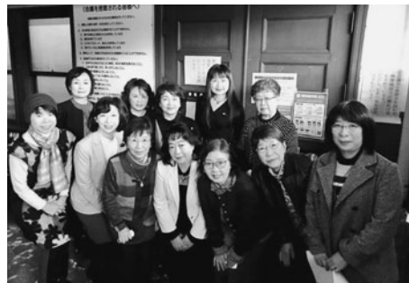
緊張感漂う議場前にて