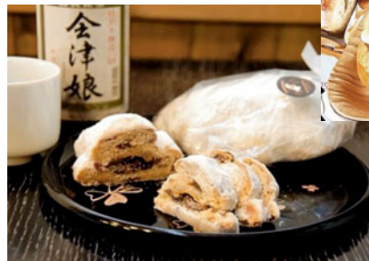
◀看板商品の「會津が香るシュトーレン」

住所：〒965-0021会津若松市山見町307 TEL：0242-22-1898 営業時間：7:00～19:00 定休日：日曜・祝日 駐車場：3台（店前に3台） 駐輪場：なし HP：http://kobipan.com/