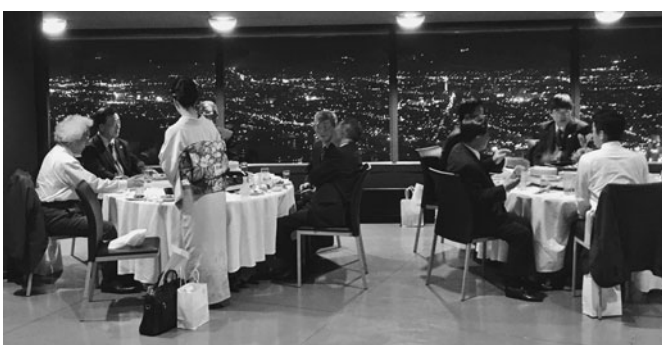
函館の夜景を楽しみながら歴史的な縁を再確認した交流会