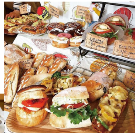
▲お店に並ぶこだわりのパン

2階にはイートイン&カフェを楽しむスペースもあります。是非一度足を運んでみてはいかがでしょうか。