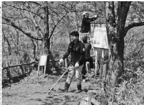
下草刈りや枝切り作業をする会員