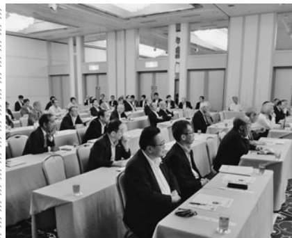
熱心に聞き入る役員・議員ら

ることが必要。また、地域ベンチャーとして生き残っていくには、具体的に明確な経営理念を社員と共有し、人財の育成と企業の社会的責任を遂行していくことが大切。」と語り、参加者はそれぞれ共感した様子で熱心に聞き入っていた。