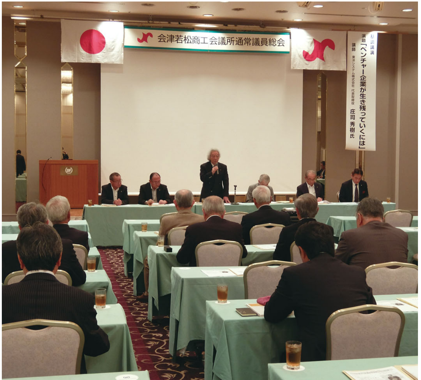
決意も新たに新年度をスタート ～通常議員総会～