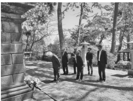
碧血碑にて献花・慰霊

翌19日は、函館市内に点在する会津藩ゆかりの地を訪問。会津藩士の墓や高龍寺傷心惨目の碑、土方歳三をはじめとする約800人の旧幕府軍戦死者の霊が祀られている碧血碑など、当時の会津藩士の足跡をたどった一行は、会津と函館の強い絆に改めて感銘を受けていた。