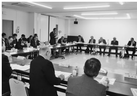
正副部会長等が事業経過の詳細を説明