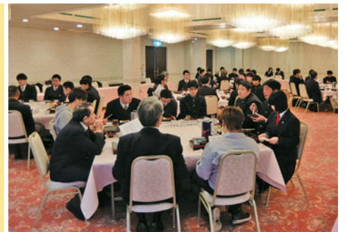
地元企業や会津ゲンバ男子へ就業の心得などを聞いた懇談の様子