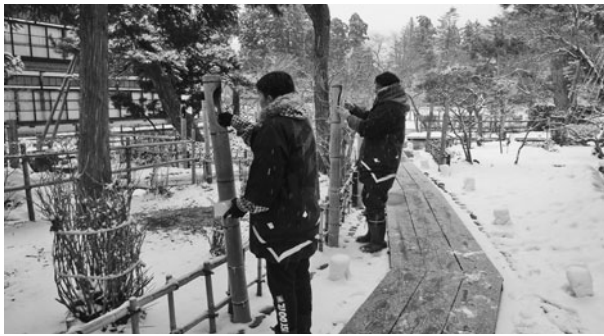
絵ろうそくの設置を行う青年部メンバー