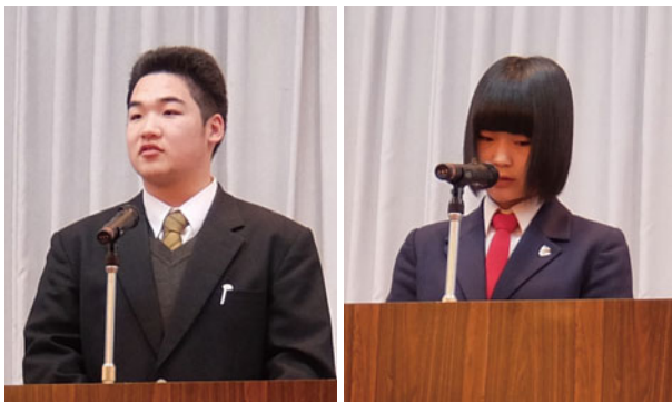
資格取得へ向けた取組などを発表する高校生