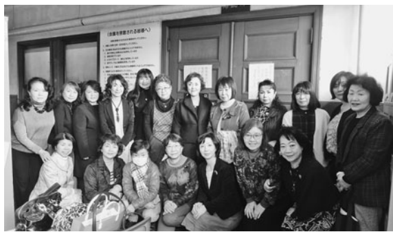
緊張感漂う議場前にて