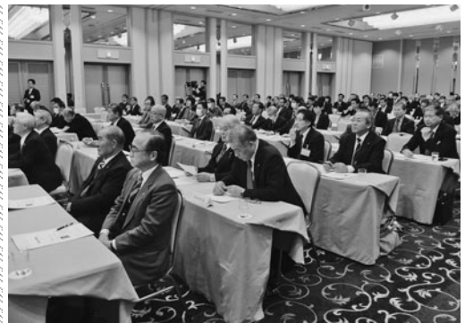
熱心に耳を傾ける聴講者

ズは、夜行列車「スノーパル2355」などの東武特急を活かして、首都圏から会津地域への旅行商品を多数企画販売し、会津地方の地域経済の振興を図っている。