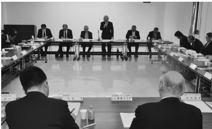
部会活動の更なる充実に向けて挨拶する洪川会頭

2月25日(月)当所において、本年度3回目となる役員懇談会を開催。役員26名が出席し、各部会の進捗状況及び新年度事業計画について懇談した。