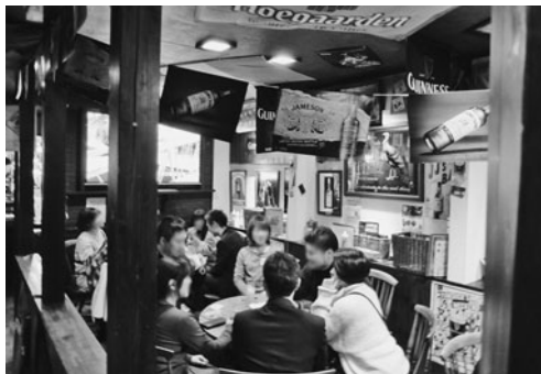
積極的に交流する参加者たち

ごした。参加者は、緊張している様子ではあったが、互いに会話や食事を楽しんでいた。