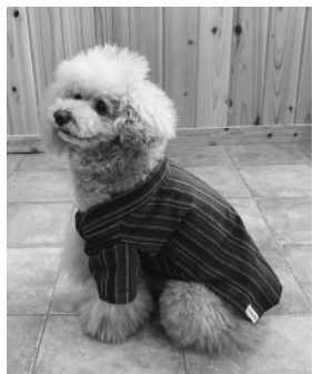
新認定品「会津木綿甚平」

これにより認定商品は50品となり、今後、ホームページでの紹介や、ブランドマーク添付による他商品との差別化、各種イベントでのPR等で販