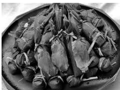
新認定品「にしんの笹寿し」

路拡大を図っていく。また、令和元年度の事業経過報告と令和2年度事業について意見を交わした。