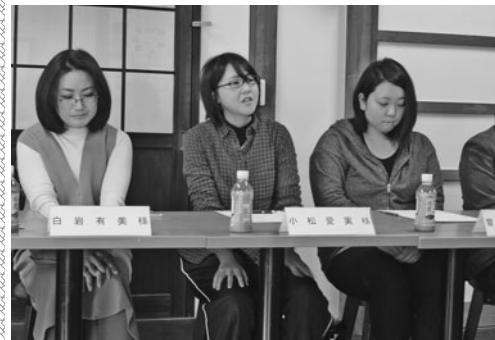
意欲的に意見交換する若手職人ら