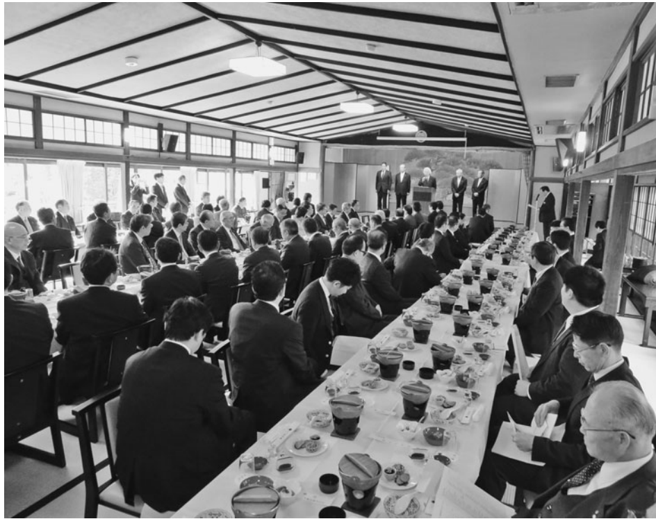
地域経済の活性化に向け更なる結束を強めた役員・議員

華々しい幕開けとなったが、大型台風など度重なる自然災害の影響が非常に強く残る一年だった。そのような中、『持続可能な地域の創生』に向けた重点課題である『起業促進』、『伴走型の各種経営支