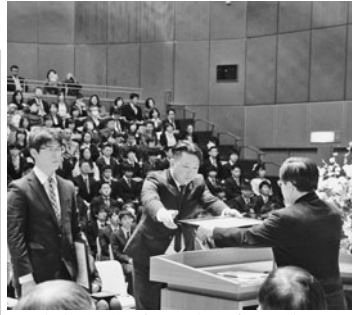
学位授与式で財団賞を贈呈

「ご寄付のお願い」 「(公財)会津地域教育・学術振興財団」 「(公財)会津地域教育・学術振興財団」 （公財）会津地域教育・学術振興財団では、皆様方のご寄付を財源に、会津大學生の海外学会論文発表に係る経費の一部助成や、奨学金制度、寄宿舎運営事業などの会津地域の学生に対する各種支援など、会津地域の情報教育の振興のため活動しております。 今後の更なる支援のため皆様方のご寄付をお願いいたします。ご支援いただければ幸いです。同封の振込用紙にてご寄付願えれば幸いです。