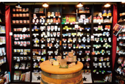
多種多様なアイテムが並ぶ店内