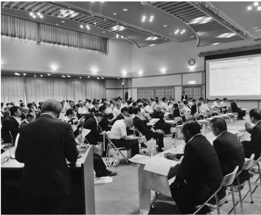
星檜枝岐商工会長が会津地域の厳しい現状を訴えた

日本からは飛行機で10〜12時間。日本とUAEの経済関係は常に良好で、石油やガスを輸入し、車や電子機器を輸出している。日本への石油供給国第1位。外資企業を優先するフリーゾーンが産業の発展を支えており、法人税の免除など様々なインセンティブが提供されている。