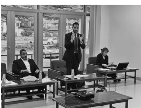
UAE経済について説明するアルアメリ閣下

◆UAEとは アブダビやドバイなどの7首長国による連邦制。中東で初、唯一成功を収めた連邦国家で建国48年。人口は98万人でUAE人2割・外国人8割。公用語はアラビア語。国土は北海道とほぼ同じ大きさで、