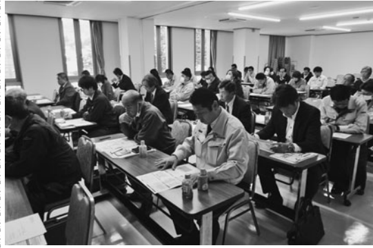
真剣に話を聞く参加者

される『働き方改革関連法』に合わせ、建設業界向けに内容を絞り込んだ「建設業のための『働き方改革』セミナー」を当所で開催し、約50名が参加した。