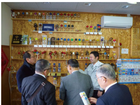
尙山形工房で熱心に話を聞く参加者

間社長は「伝統工芸品は認定品数が増えているが、職人不足が懸念材料。工芸品の本質は、モノではなく技能を残すことであり、職人の育成に力を入れていきたい」と語り、伝統を守りつつ、マーケットのニーズに合った多様な作品に挑戦する姿が印象的であった。 2日目は、山形県長井市の40年にわたりけん玉などの木製玩具を製造する「尙山形工房」を視察。けん玉の生産が日本一の当社では海外でのけん玉人気が高まっていることもあり、スマホアプリを開発、更には数々の有名企業とのコラボ商品やノベルティの受注も受ける