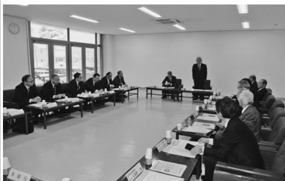
挨拶する洪川会長