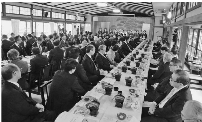
更なる連携と結束を強めた出席者

ている。会頭就任時より掲げている『持続可能な地域の創生』の取組では、新たに福島県・会津若松市・まちづくり会津と連携した『歩いて暮らせるまちづくり強化プロジェクト事業』に着手し、空き店舗を活用した創業支援に傾注している。これらのソフト事業の推進とともに、地再開発事業などダイナミックに展開していきたい。