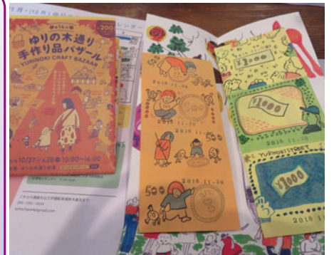
温かみのある手作り感満載のチラシや商品券

「年末ジャンボ宝くじ」のCMを多く見るようになり、「今年もそろそろ終わりだな」と思います。そんなジャンボ宝くじも今回の年末ジャンボ宝くじからインターネットでの販売解禁と共に、クレジットカード決済もできるようになりました。これは宝くじを買いやすくて購入の機会を増やす若者離れ対策とした狙いがあると思います。クレジットカードで購入すると、クレジットカードと宝くじ両方のポイントが貯まるだけでなく、PC・スマートフォンで24時間いつでも購入でき、当選金は登録口座に自動で振り込まれるなど、換金忘れもないので非常に便利でお得みたいです。 しかし、これまでの年末ジャンボ宝くじのようにこだわりの購入や「どこで買うか？」という楽しみの一つがなくなり、さらには当選発表のわくわく感がそがれてしまふのは残念かもしれません。 今月の21日が販売最終日ですが、私は例年通り店頭と並んで年末ジャンボを楽しみながら新年を迎えたいと思います。 （築取）