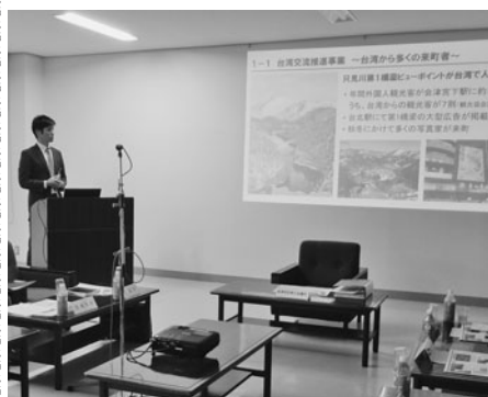
三島町の取り組み説明

相互交流・理解の促進を目的とした第1回「台湾⇄会津研究会」が11月20日、会津若松商工会議所で開催され、三島町と北塩原村の取組について担当者から話を聞いた。研究会は当所や県立博物館等で