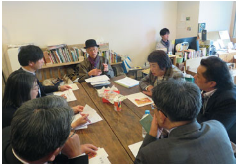
活動の拠点コミュニティスペースで説明を受けるゆりの木通り商店街

各視察先では、それぞれの視察先商店街の取組や活動内容を受け、今後、自らの商店街での活動や部会事業に活かそうと、参加者から大変多くの質問や意見が飛び交った。 今回の視察では、商店街視察のほか、会津藩士で初代長崎市長となった北原雅長の墓所等も訪れ、会津ゆかりの歴史にも触れる視察研修会となった。