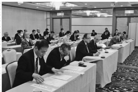
説明に聞き入る参加者

会津若松市中心市街地活性化協議会（会長・渋川会頭）と七日町通りまちなみ協議会（同）は11月18、19日の両日、先進地視察研修を実施し、岐阜県恵那市や愛知県犬山市を訪問。両会から20人が参加した。 恵那市では合併前の旧明智町にある大正村、同じく旧岩村町の岩村本通りを視察。 大正村は蚕糸で栄え、明治末以降の建物が保存されている地域。見応えある建物が点在しており、街歩きが楽しめた。 岩村本通りは、国の重要伝統的建造物保存地区になっており、商家等が軒を連ねている。本年上期