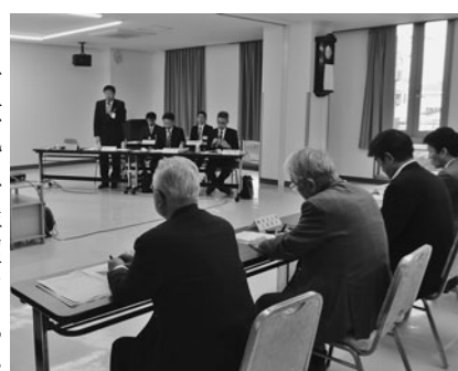
質問に対し丁寧に回答する室井市長ら