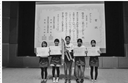
20日グランプリ・(株)一箕5GIRLS