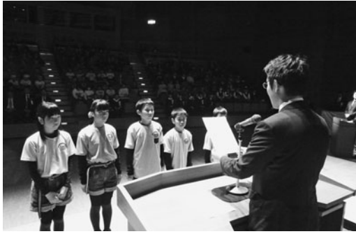
参加者全員へ修了証書を授与

次に今回参加した22チームの中から、グランプリ賞2チーム、準グランプリ賞2チーム、そして、各銀行賞が発表され、それぞれに賞状と記念品を贈った。また、参加した子供達110名全員に修了証書が手渡され、7月のドリームセミナーからアクティブセミナー（合宿）、販売実践、まとめセミナー・決算発表会を経て、今回の表彰式により、全てのカリキュラムを終了した。各賞の受賞チームは次のとおり。