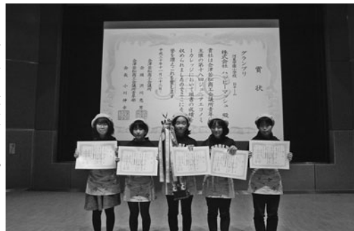
21日グランプリ・(株)ハッピーマッシュ

このジュニアエコノミーカーレッジ事業は、小学生5・6年生の5人で1チームを編成し、模擬会社を設立。商売の楽しさや難