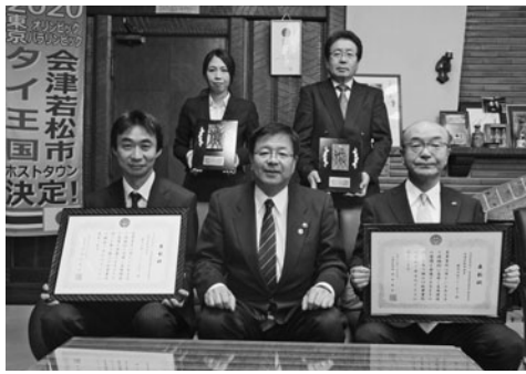
今回受賞された2事業所

平成30年11月14日、会津若松市長室において、「会津若松市障がい者雇用優良事業所顕彰事業表彰式」が開催され、室井市長より2社に表彰状と盾が手渡されました。 この事業は、障がい者を積極的に雇用し、雇用環境を整えるなど他の事業所の模範となる事業所を「会津若松市長賞」として表彰し、その素晴らしい取組を市民の方や企業に広く啓発することにより、市全体の障がい者雇用意識の高揚を図ることを目的に実施しています。 受賞事業所は次のとおり。 株式会社グリセス 総合警備保障業 障がい者雇用率 営業所 3.53% (全体 2.33%)