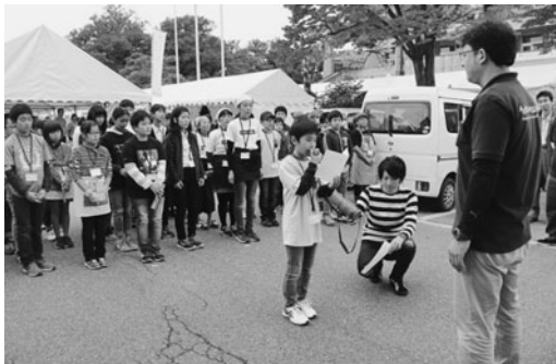
元気よく選手宣誓

10月20日・21日に鶴ヶ城体育館で開催された会津ものづくりフェアにおいて、「ジュニアエコノミーカーレッジ」販売