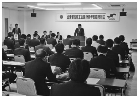
挨拶する小川会長