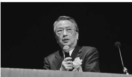
インバウンドをカギとした観光の未来について語る清野理事長

述べた。各地の観光振興への取組をたたえる「全国商工会議所きらり輝き観光振興大賞」の表彰式等に続き、基調講演が行われ、清野智日本政府観光局（JNTO）理事長が「地方観光地を持続させるために」をテーマに語り、観光地が持続的に成長するために必要な方策について提言した。