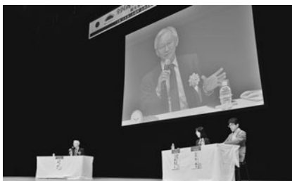
「観光地とは何か」を探ったパネルディスカッション