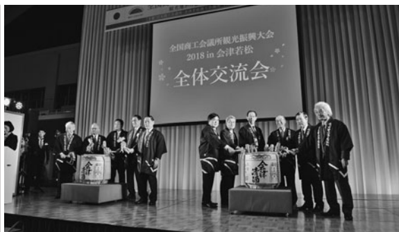
さらなる観光振興を祈念しての鏡開き

初日夕からは、あいづ総合体育館に会場を移し、全体交流会が開かれた。東山芸妓衆による歓迎の祝舞で開幕。会津を中心とした県内各地の食材による料理を提供したほか、全国新酒鑑評会で史上初の6年連続金賞受賞蔵数全国一に輝いた本県の地酒を振る舞い、風評払拭に向けて本県のグルメを堪能していた。同時に県内の物産を販売する福島物産展も開催した。