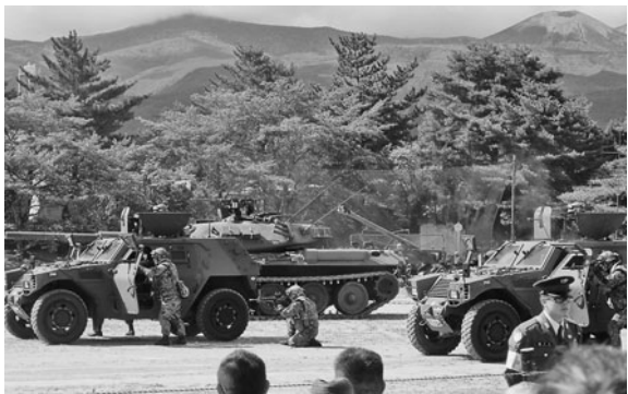
迫力ある訓練展示

洪川会頭より「商工会議所の幹事業である部会活動について互いに共通認識を持ち、一致団結して後半戦も活発な事業展開をしていきたい」と挨拶。その後、当所9部会それぞれの事業の進捗状況及び今後の活動について、各部会の正副部会長等より報告。各業界のPRに資する事業や、様々なセミナー・視察研修事業など、各部会それぞれの業界の動向等に合わせた事業を展開。また、異業種交流事業や他部会との連携事業等も活発に実施しており、今後も各部会の更なる相乗効果を図るべく、情報の共有を図った。