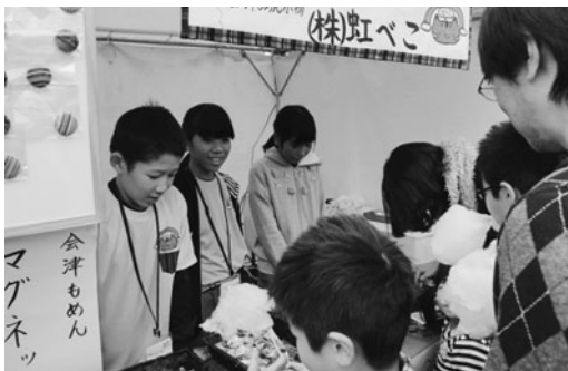
熱心に販売する児童たち

を決算し、チームごとに発表。これらを基に審査を行って11月23日の会津大学講堂での表彰式でグランプリ、準グランプリチームを決定する。