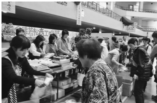
多くのお客様で賑わったチャリティバザー

なお、本チャリティバザーの益金については、今後協議し、社会福祉関係に充当する予定。