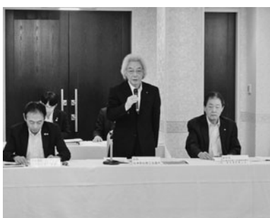
商工観光団体と県議との懇談会（懇談会に先立ち挨拶する渋川会長（中央）