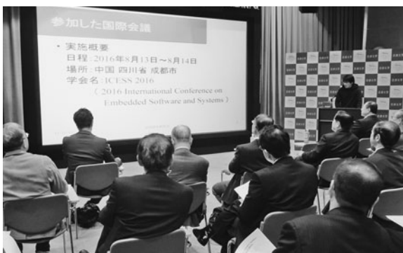
毎年実施している助成学生報告会の様子