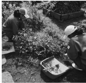
御菜園で庭園の手入れを体験

当所としても、子供たちの就業意識の向上や優秀な人材の地元定着のため、今後も様々な取組を行う。