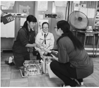
お客様に笑顔で商品を手渡す生徒

この職場体験では、仕事を通して色々な経験をし、「働くこと」の大切さや忍耐力、お客様はもちろん職場の上司や同僚に対する礼儀や挨拶の重要性など、就業意識の向上を目指しており、