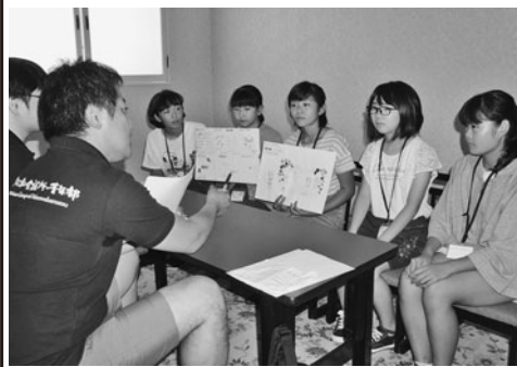
販売商品プランをプレゼンする真剣な児童たち

9月8日(土)～9日(日) ホテルいづみやにおいて、小学5・6年生対象の起業家育成プログラム「第18回ジュニアエコノミーカーレッジアクティブセミナー(合宿)」を開催。12小学校109名の児童が参加。当日は、市内のスーパー等で商品陳列と販売や接客等を見学。座学では、商売のルールやビジネススマナー等を学んだ。その後、自分たちが販売する商品プランや店づくり、資金面などについて話し合いながら、懸命にビジネスプランをまとめ、借入をす