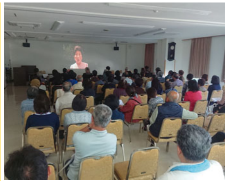
勢津子殿下のご遺徳・ご功績を偲んだ映写会

9月28日（金）、当所において秩父宮妃勢津子殿下御生誕110周年御成婚90周年記念映写会を、秩父