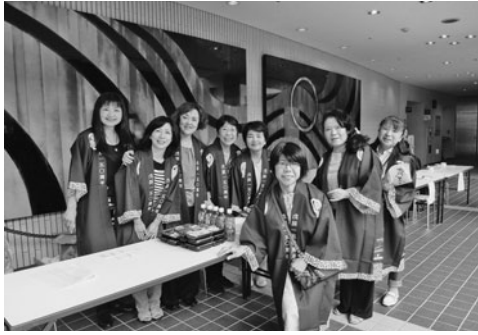
女性会メンバーの笑顔でおもてなし

当日演奏された曲目は、ベイトーヴェン作曲「交響曲第9番ニ短調」や、リヒャルト・ワーグナーの曲が披露され、記念すべき年に相応しい演奏会となった。