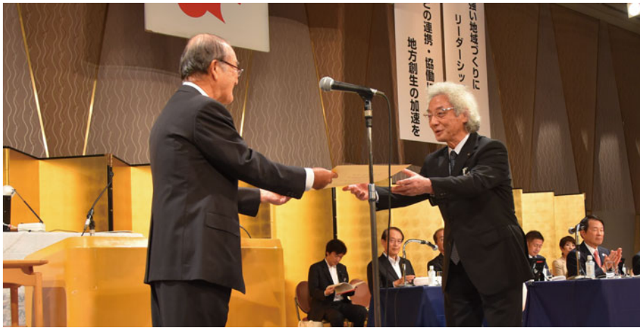
三村日商會頭より表彰状を受け取る渋川會頭

「ゆかりの地CCI観光ネットワーク」は、平成27年8月、戊辰戦争に縁のある会津若松、むつ、余市の3商工会議所の会頭副会頭懇談会にて、「ゆかりの地CCI観光ネットワーク」形成について当所から提案。戊辰