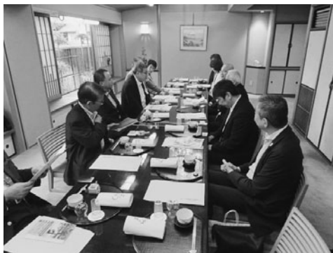
京都商工会議所食品・名産部会との意見交換会

事業展開を行っている老舗企業の取組やノウハウを参考とし、会津の食の発展を通して、当市地域経済の活性化を図ることを目的に実施。