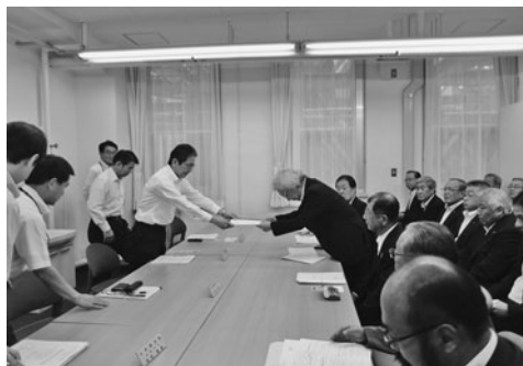
杉土木部長へ要望書を手渡す渋川会長(中央・右)