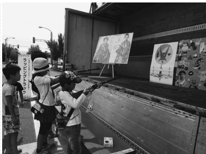
真剣に的を狙う子供たち

当日は、会津清酒と会津漆器が描かれた大型ラッピングトラック（10t）の展示とともに、これまで制作した様々なデザイン