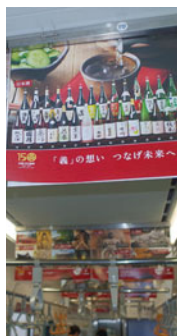
地域情報を発信する広告が並ぶ車内