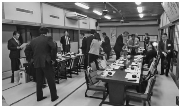
活発に名刺交換などを行った昨年の懇談会