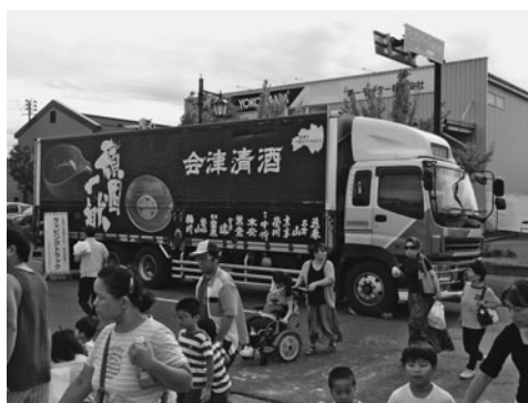
展示したラッピングトラック

製作は、平成18年度から実施し、これまで製作した9台のラッピングトラックが首都圏をはじめ、全国各地を「走る広告塔」として走り回り、会津地域のPR促進に繋がっている。