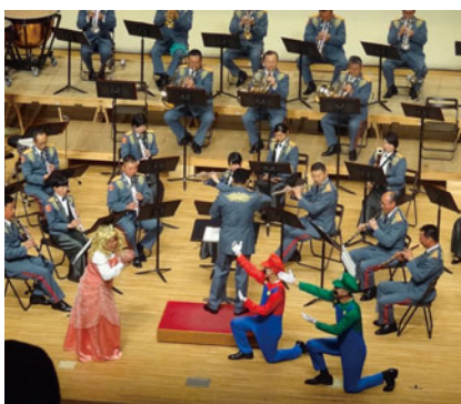
スーパーマリオも登場した陸上自衛隊東北方面音楽隊の演奏

今回は、仙台駐屯地に所在し、東北6県を活動範囲としている「陸上自衛隊東北方面音楽隊」によるふれあいコンサート。吹奏楽コンクール課題曲や、ゲームキャラクターも登場した「スーパーマリオブラザーズ」、原発事故の避難生活で離ればなれになってしまった仲間を思って小高中学校が作っ