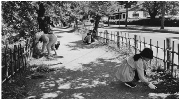
爽やかな汗を流しました。

会員21名が参加し、歩道沿いのゴミ拾いや草むしりを中心に作業を進め、最後に八重の像の周辺を清掃した。 当日は、30度を超える真夏日となったが、作業中は時折心地よい風が吹き、爽やかな汗を流しながらの作業となった。 本年は特に、戊辰150年の節目の年であることから、会津に多くの方にお越しいただきたいという気持ちが強まり、作業にもより一層力が入っていた。 奉仕作業終了後には場所を移し、創立25周年記念で東山ダム湖畔に植樹した「コヒガンザクラ」の環境整備事業を実施。役員等10名が、桜の木周辺の草むしりや清掃と併せて、華麗に成長している桜の木の育成状況を確認した。