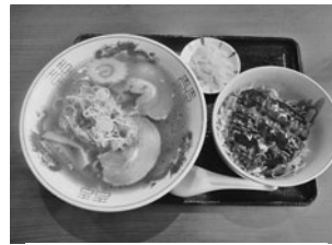
▲一番人気の「ラーメンとミニ会津ソースカツ丼セット」