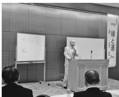
講演する渡邊常議員