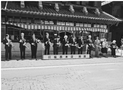
テープカットで華やかにオープン

福西本店は、江戸中期から城下町会津若松市の中心部で豪商として名を馳せた福西家の住居兼店舗市歴史的景観指定建造物の第1号に指定されている。黒漆喰の蔵や二階建ての母屋など大小8棟からなり、往時の若松商人の繁栄ぶりがかがられる。今後、会津産品セレクトショップやギャラリーとしての活用を計画するほか、県立博物館との連携事業など多彩な催