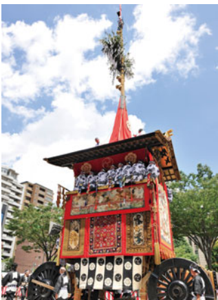
前祭の山鉾巡行(函谷鉾)

【内容】疫病退散を祈願する同神社の祭礼で、京都三大祭のひとつとして親しまれている。7月17日の前祭、同24日の後祭各々の山鉾巡行をはじめ、一か月にわたり様々な神事・行事が繰り広げられる。山鉾巡行では、ゆっくり観覧できる有料席を販売。