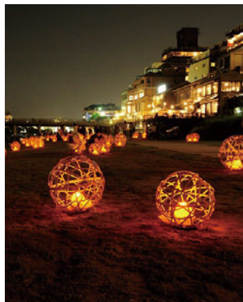
京の七夕(鴨川エリア)

【内容】古くから伝わる七夕節句の意義や云われを見つめ直し、その伝統を引き継ぎつつ、伝統産業や和装の振興などの観点も含めた京都ならではの現代版・七夕まつりとして開催。七夕笹飾りやライトアップ等を実施する。