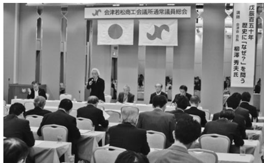
挨拶する洪川会頭

洪川会頭より、「本年11月には、いよいよ全国商工会議所観光振興大会in会津若松を開催する。大会を成功させ、会津若松のブランド価値向上につなげたい。また、会津地域経済の疲弊が顕著であるが、こうした状況だからこそ、地域経済を支える中小企業と密接に関わることのできる商工会議所の役割はますます重要となる。本年度も『持続可能な地域の創生』を目指し、各種事業等に取り組んでいきたい。」との挨拶後、議事に移った。