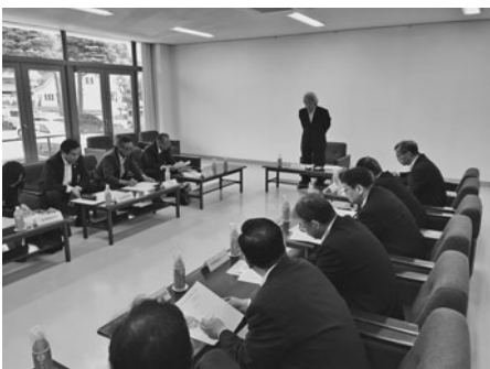
挨拶する洪川会長