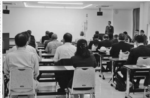
川野本部長による記念講演会

会津若松自衛隊協力会（会長：洪川会頭）は5月18日、当所において総会を開催。役員、会員等約35人が出席した。