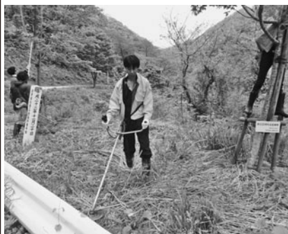
枝木の剪定、下草刈りを行う青年部メンバー

当日は、会員、OB会員、会津東山温泉観光協会会員、東山消防団、約50名が参加。桜の成長の妨げになっている雑木を切