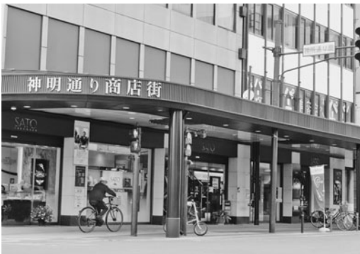
完成したアーケード

会津木綿をモチーフにしたデザインや天窓、七色に輝くLEDライトなど、明るい雰囲気生まれ変わったアーケード。中心市街地