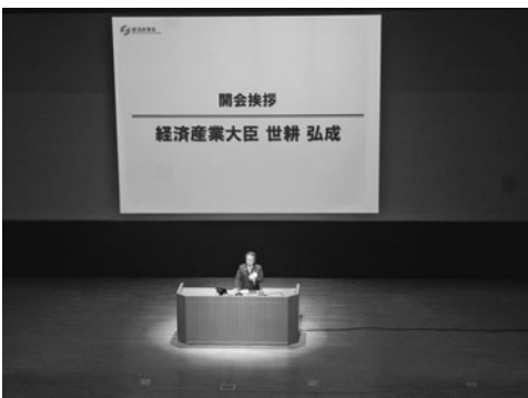
開会の挨拶をする世耕経済産業大臣

全国の選定企業2,148社から約460社が参加し、商工団体や金融機関の関係者も含め、出席者は約1,100人。県内からの選定