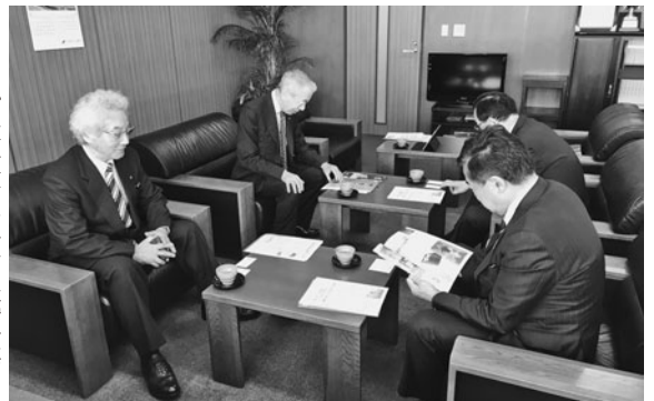
福田・新潟会頭(右)と懇談する渋川会頭(左)と竹田副会頭