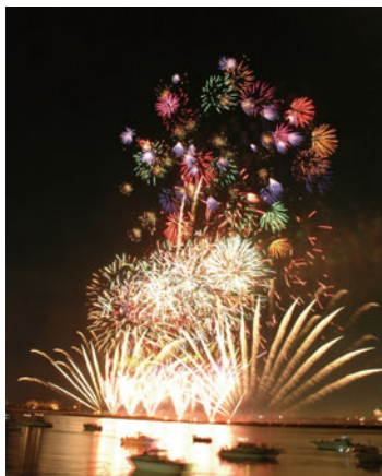
夏の夜を彩る水郷花火大会

【内容】 昭和9年、伊勢大橋の完成記念で始まった。数先発のスターマイン、水中花火、東海地区最大級の二尺玉の大音響と広がり、頭上に降りそそぐよう。桑名の夜を彩る夏の風物詩。