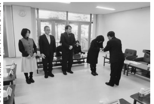
高等学校への助成なども実施