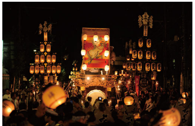
石取祭の様子(田町での曳き別れ)