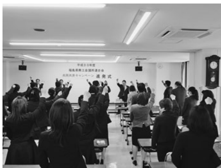
全員で「ガンバロー！」