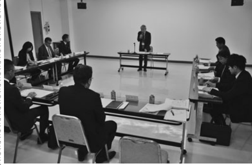
座長の竹田副会頭が挨拶

また会議では、出席の各支援団体から産学官連携などによる取組事例等の報告・説明があった。